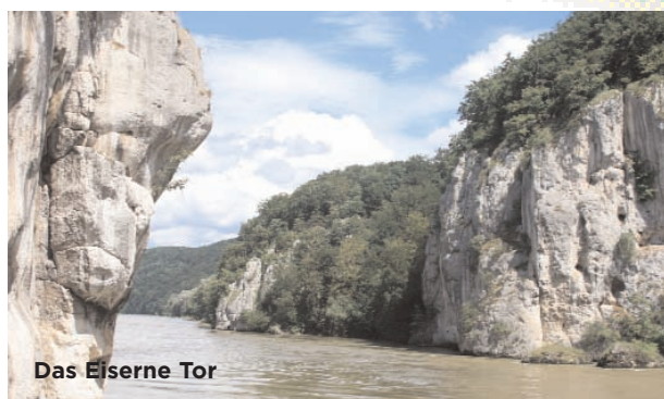
Das Eiserne Tor