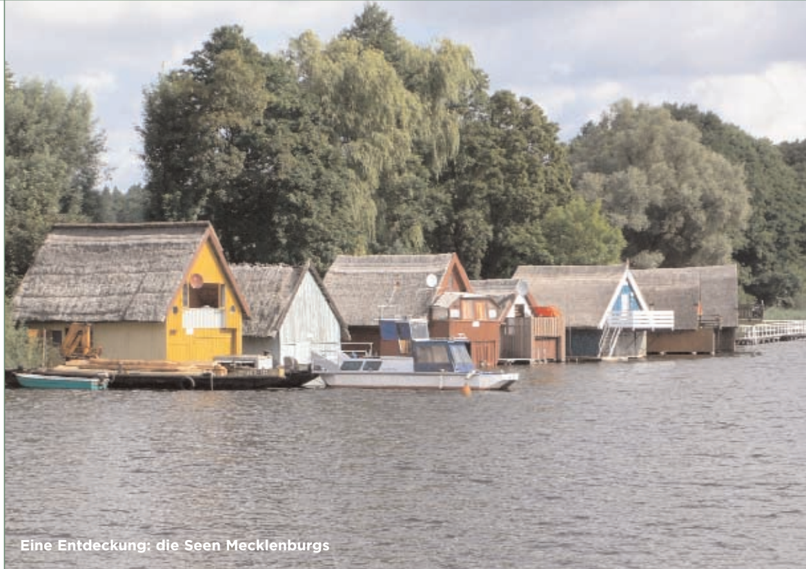
Eine Entdeckung: die Seen Mecklenburgs