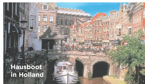
Hausboot in Holland

Anreise spricht für Mecklenburg-Vorpommern, Holland und Belgien. Naturfreunde werden sich in Schottlands Highlands, auf Irlands Shannon oder auf der polnischen Seenplatte besonders wohlfühlen. Wer Wert auf historische Orte und gutes Essen legt, ist natürlich in Frankreich oder Belgien bestens aufgehoben. Wer nur zu zweit reist und körperlich nicht mehr hundertprozentig fit ist, sollte Flüsse und Kanäle mit vielen manuellen Schleusen meiden. Es gibt also ein paar wichtige Kriterien, aber generell gilt: Von der Themse bis zur Lagune von Venedig, von der Müritz in Mecklenburg bis zum Canal du Midi in Südwestfrankreich – jede Region hat ihren ganz besonderen, eigenen Reiz.